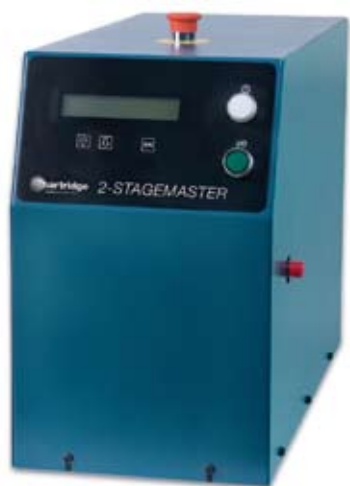
Иллюстрация 1 2 Stagemaster HN720.