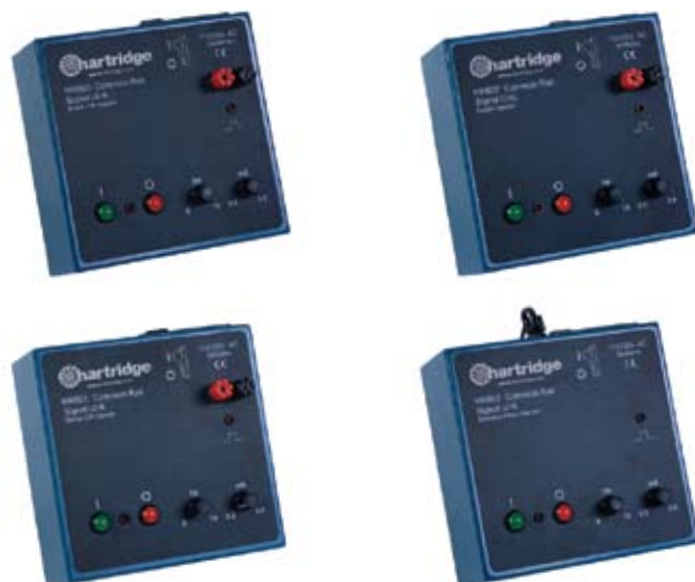
Иллюстрация 2 Common Rail Блоки управления НК850, НК851, НК852, НК853.